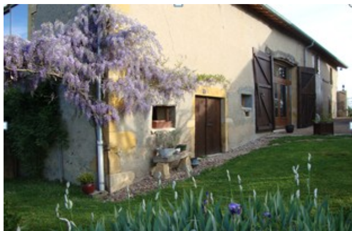
La Maison du Temps pour Soi