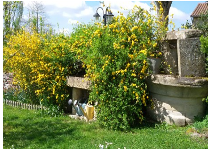
Un jardin luxuriant