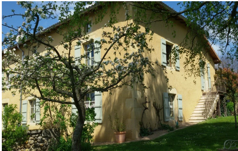
Une maison d'hôtes pleine de charme