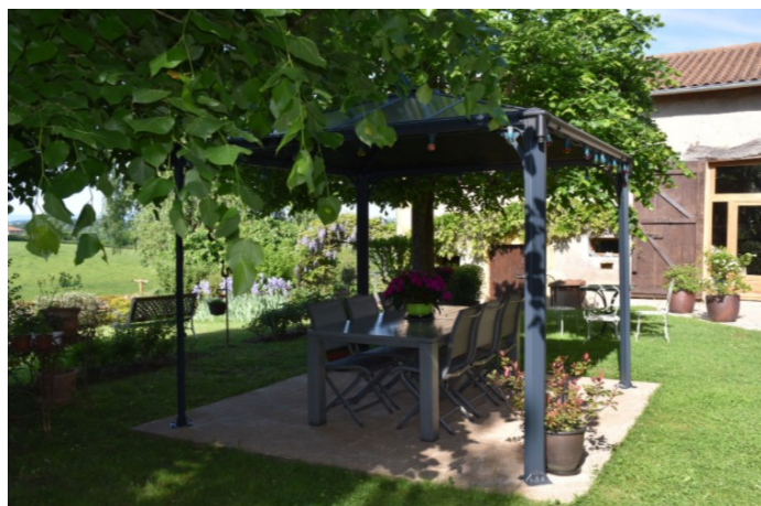
La pergola pour la joie d'expérimenter en extérieur et partager les repas.